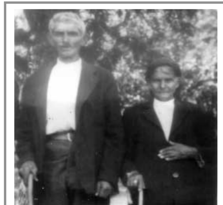
Ευλογημένα νιάτα και καλά γεράματα είναι η καλύτερη ευχή στο Δίκαστρο.