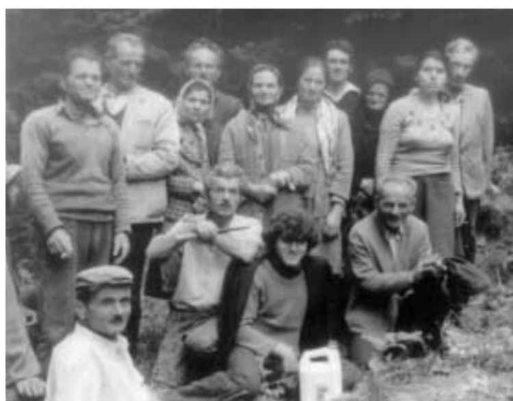
1977 Στο Λάπατο και στη θέση «Λαμαρόγιαννος» σε εργασίες αναδάσωσης της περιοχής. (Δικαστριώτες και Περιβλεπτιώτες).