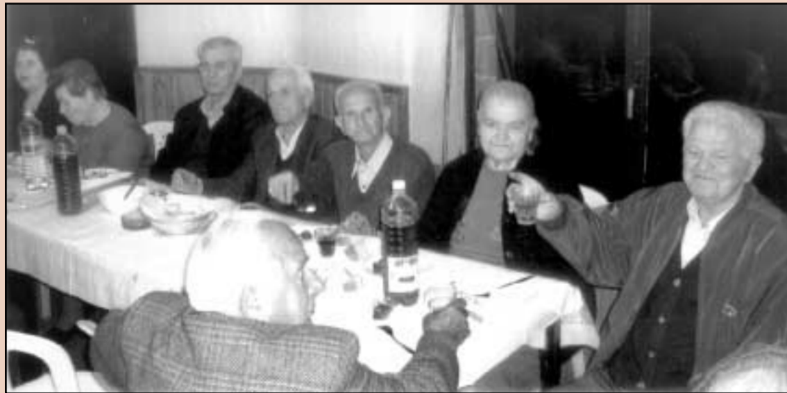
Μετά την Εκκλησία στο μαγαζί για το καφεδάκι τους