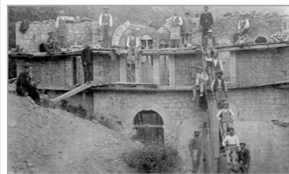
Η ανέγερση του Ναού του πολιούχου Ζημιανής (Δικαστρου) Αγίου Γεωργίου, 1925-1927.

Στην απογραφή του Απριλίου 1879 η Ζημιανή είχε 313 κατοίκους, περίπου 60 οικογένειες και στην απογραφή της 15ης Απριλίου 1889 η Ζημιανή βρέθηκε με 629 κατοίκους, περίπου 120 οικογένειες. Την περίοδο αυτή, δεκαετία 1879-1889, η Ζημιανή ήταν ο πρώτος, ο μεγαλύτερος, σε πληθυσμό οικισμός από τους 18 οικισμούς του Δήμου Τυμφρηστού. Ήταν η περίοδος της πληθυσμακής ακμής της Ζημιανής.