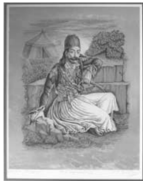
Δοκίμιο, Λιθογραφία, «Ο. Γ. Καραϊσκάκης» του Παναγιώτη Η. Γράββαλου (Μουσείο Δικαστρου)

Ο Παναγιώτης Η. Γράββαλος σπούδασε ζωγραφική, την τέχνη της αναπαράστασης μορφών και σχημάτων, στην Ανωτάτη