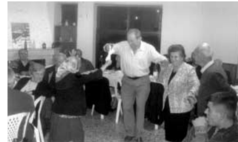
«Νάταν τα νιάτα δυο φορές...»

Κάθε γιορτή έχει μια ιδιαιτερότητα για τους κατοίκους της υπαίθρου και σε τούτο συμβάλλει η ημεράδα του τοπίου, ο χαρακτήρας των ανθρώπων, των οποίων η ζωή είναι στενά δεμένη με τη λατρεία και τη θρησκευτική πίστη.