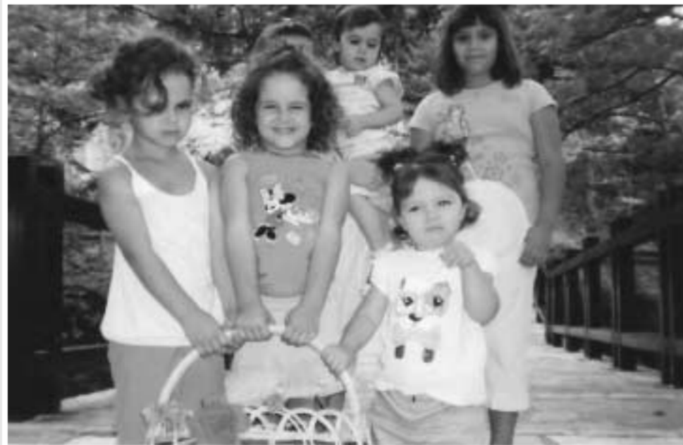
Φίλοι αναγνώστες καμαρώστε το μέλλον του Δικαστρου. Αυτά τα παιδικά πρόσωπα με τα όμορφα μάτια θέλουν το Σύλληγό μας δίπλα τους, αξίζουν κάθε θυσία!

Αν μέσ' τα Πανεπιστήμια, τα σχολεία, τα γυμναστήρια, τα εργοστάσια, τα στρατόπεδα κι όπου αλλού μπορεί να βρεθεί αίμα νεανικό να δώσει το παρόν η Εκκλησία και να δουν οι νέοι στο πρόσωπό της τον Χριστό παρατεινόμενο στους αιώνες, τότε είναι δυνατόν να ελπίζουμε σε μία αλλαγή πορείας. Τότε θα σταματήσει η «τρέλλα» σ' όλες τις μορφές της και η αυγή της βασιλείας του Θεού στη γη γλυκοχαράζει.