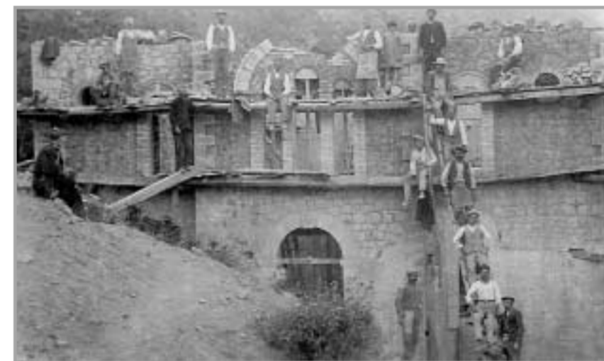
Η ανέγερση της καινούριας εκκλησίας του Αγίου Γεωργίου (1925-1927)