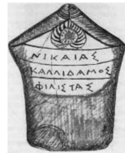
Επιτύμβια στήλη Δικάστρου (Νικαίας, Καλλιδαμος, Φιλίστας) (Σκίτσο Γεωρ. Κ. Καρφή)

Τα ονόματα, που δίνονται κατά το Βάπτισμα, είναι χριστιανικά, αρχαιο-ελληνικά, Βυζαντινά, παραδοσιακά, κ.α. « Εθός αρχαιοτατον εστί » να δίνονται στα εγγόνια τα ονόματα του παππού και της γιαγιάς, για να διατηρείται έτσι η οικογενειακή τάξη και η μνήμη των προγόνων και να μεταδίδεται από γενιά σε γενιά η ελληνο-χριστιανική παράδοση.