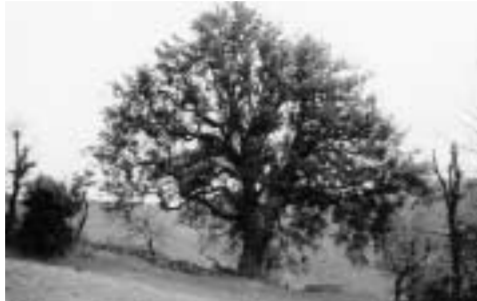
Το πουρνάρι, πριν πέσει

(Το άρθρο αυτό αναδημοσιεύεται, γιατί από τις 29 Νοεμβρίου 2010, το πουρνάρι δεν υπάρχει, έπεσε, το γκρέμισε ένας δυνατός αέρας, δεν άντεξε.... Κάποιοι, πριν από μερικά χρόνια, τρύπησαν επικίνδυνα τον κορμό του μέχρι το κέντρο του, για να εξακριβώσουν, όπως είπαν, την ηλικία του και από τότε άρχισε το τέλος της ζωής του...Οι προγονοί μας διέσωσαν αυτό το ιερό σύμβολο της ιστορίας του χωριού .... Εμείς, οι απόγονοί τους, αφήσαμε κάποιους, κάποιους ασυνειδήτους, να το κακοποιήσουν..., κριτές μας, οι νεκροί και οι αγέννητοι του χωριού μας.... κριτές σκληροί, και δικαίως... Και τώρα μια πρόταση: ένα κομμάτι του κορμού του πουρναριού, πρέπει να μεταφερθεί και να εκτεθεί στο Μουσείο μας, να διασωθεί..., ας το φροντίσουν, αυτό, ο Δήμος, ο Σύλλογος....).