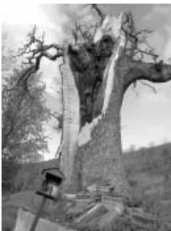
Το πουρνάρι, σήμερα