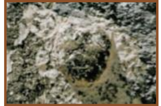
1896, Σύμβολο Σελήνης, στο σπίτι του Λεωνίδα Καρφή, στο Δίκαστρο.

Ο Βασίλειος Ι. Καρφής (1909), στο «Τετράδιό» του, για το πώς απάντησαν οι πρόγονοί μας, όταν έμαθαν για την κίνηση της γης περί τον άξονά της, έγραψε τα εξής: Έλεγαν κάποτε οι δάσκαλοι εδώ,