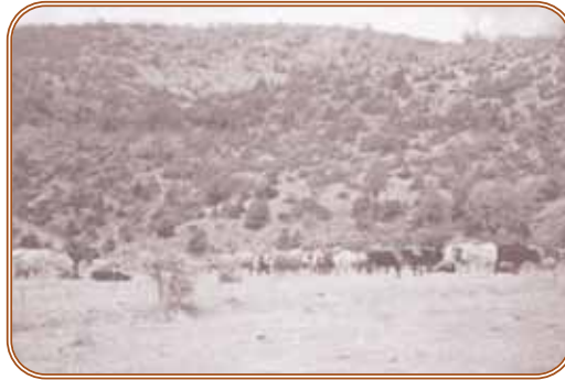
Το «Γρέκι» ή «Γελαδό-Γρεκο», στο Λάπατο (1960)

Στο Λάπατο επικρατούσε η «Αρχή της Ισχύος του Ενός». Το Βόδι-Νικητής ήταν ο άρχοντας του «Βοιδο-Λίβαδου». Στο πέρασμά του, όλα τα άλλα βόδια παραμέραγαν. Είχε το προβάδισμα, την προτεραιότητα, ήταν επικεφαλής της αγέλης. Προηγούνταν, ηγούνταν, στη βοσκή, στο πότισμα. Πρώτο, ανυποχώρητο, και στην απόκρουση των κινδύνων.