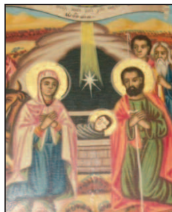
Η Γέννηση του Χριστού (Εικόνα Τέμπλου Ναού Αγίου Γεωργίου Δικάστρου)

ποταμό. Η εορτή λέγεται και «Επιφάνια» και «Φώτα ή Εορτή των Φώτων». Σύμφωνα με τις ευαγγελικές περικοπές, ο Ιωάννης ο Πρόδρομος, υιός του Ζαχαρία και της Ελισάβετ, ο Βαπτιστής, ο οποίος διέμενε στην έρημο, ασκητεύοντας και κηρύττοντας το «Βάπτισμα της Μετανοίας», βάπτισε, με Θεοφάνεια, και τον Ιησού Χριστό στον Ιορδάνη ποταμό. Κατά δε τη στιγμή της Βάπτισης του Χριστού «εφανερώθη η της Τριάδος Προσκύνησις: του Γεννήτορος η φωνή προσεμαρτύρησε σε αγαπητόν Υιόν ονομάζουσα και το Πνεύμα επεφάνη εν είδη Περιστεράς και εβεβαίου του Λόγου το ασφαλές», ενώ ηκούσθη «Ούτος εστίν ο Υιός μου ο αγαπητός εν ω ευδόκισα».