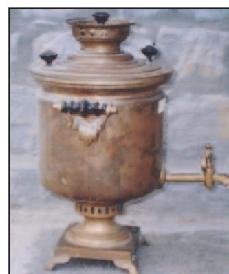
Κολυμπήθρα (μικρή) Αγιασμού Ναού Αγίου Γεωργίου Δικάστρου (Μουσείο Δικάστρου)