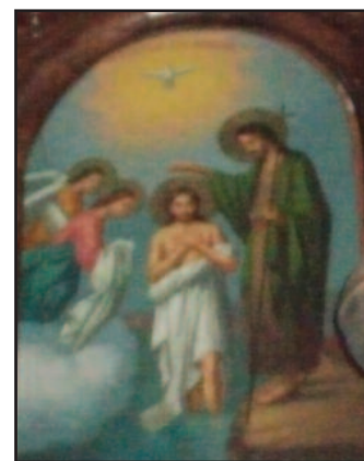
Η Βάπτιση του Χριστού (Εικόνα Τέμπλου Ναού Αγίου Γεωργίου Δικάστρου)