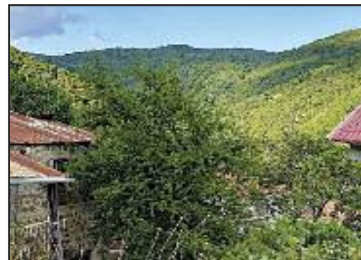
Η θέα προς τον Αη Λιά Ροβολιariού όπου θα μπουν ανεμογεννητριες αν εγκριθεί η άδεια εγκατάστασής τους