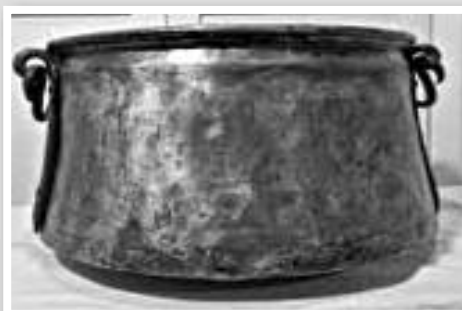
Καζάνι χάλκινο, για πλύσιμο ρούχων

Στη συνέχεια έβγαζαν τα ρούχα από το Καζάνι, τα ξέπλεναν με κρύο τρεχούμενο νερό, μέσα στις Γούρνες, τα πατούσαν με τα πόδια ή τα κοπάνιζαν με τον «Κόπανο» ή τα έτριβαν με τα χέρια τους, για να καθαριστούν καλλίτερα και μετά τα άπλωναν στους πέριξ φράκτες ή τις ξερολιθιές για να στεγνώσουν. Έτσι τα ρούχα γίνονταν κατακάθαρα, γυάλιζαν, άστραπταν και όπως έλεγαν γίνονταν «Λαμπίκος».