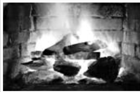
Τζάκι με Φωτιά και Στάχτη

του σπιτιού, την οποία έριχναν μέσα σε ένα Καζάνι, με καυτό νερό και έτσι σχηματίζονταν ένα αφέψημα, το οποίο ονόμαζαν «Αλίσίβα» ή «Σταχτόνερο». Μέσα στο Καζάνι έβαζαν τα ρούχα ένα-ένα και τα έβραζαν, ενώ συγχρόνως τα ανακάτευαν με ένα Αναδευτήρα (ξύλο στρογγυλό, με λαβή) για να ανακατευθούν και να πλυθούν καλά, καθώς η «Αλίσίβα» περιείχε πολλά ιχνοστοιχεία, τα οποία απολύμαιναν και καθάριζαν σε βάθος τα ρούχα.