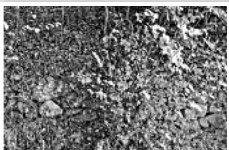
Ξερότοιχος, στη Βρύση Μπούρα για άπλωμα ρούχων ( Όπως είναι σήμερα)

«Πλυσταριά», από τη φύση τους, στο Δίκαστρο, μέχρι και τα μέσα του προηγούμενου αιώνα, υπήρχαν σε τρεις τοποθεσίες του χωριού, (i) στη βρύση «Μπούρα», όπου το νερό έρχονταν από τον «Ποτιστή», (ii) στο «Ρέμα Βέλη», όπου το σημερινό γεφύρι και (iii) στο «Μύλο», όπου ήταν η έξοδος του νερού μετά την άλεση. Άλλα, πρόχειρα «Πλυσταριά», στα οποία υπήρχαν την άνοιξη και το Φθινόπωρο τρεχούμενα νερά, ήταν στις τοποθεσίες «Ζαΐρα», στο Κοτρόνι και «Πλούμπου» στη βρύση στον πέρα-Μαχαλά.