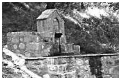
Πλυσταριά, στη Βρύση «Πλούμπου»

Το αρχαιότερο και κυριότερο απορρυπαντικό πλυσίματος ρούχων, μέχρι και τον προηγούμενο αιώνα, ήταν η «Στάχτη» από την καύση των σκληρών ξύλων στο Τζάκι