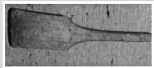
Κόπανος, ξύλο πλατύ με λαβή, για το κοπάνισμα των ρούχων

Στην παράδοση, ανά τους αιώνες, αναφέρονται και άλλα είδη απορρυπαντικών, μερικά από αυτά ήταν τα εξής: Στην Ομήρου Οδύσσεια αναφέρεται, ότι η Ναυσικά, θυγατέρα του βασιλιά των Φαιάκων, πήγαινε με τις υπηρέτριές της στη Θάλασσα, όπου χρησιμοποιούσαν ως απορρυπαντικό το θαλασσινό νερό και εκεί έπλεναν τα ρούχα της βασιλικής οικογένειας.